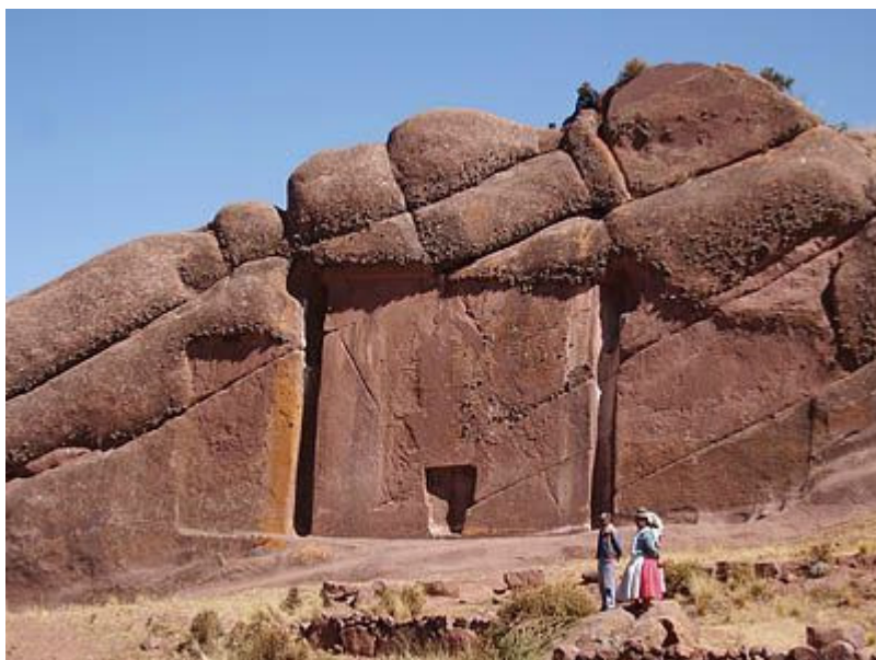
Etrange porte qui semble être connecté avec de nombreux site sur terre et certainement le site du roi Midas en Turquie